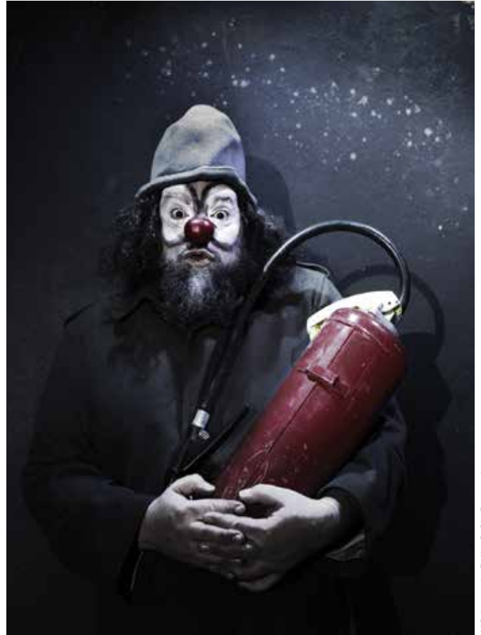
L'Oripeau du Pollu

Clown mélopyromane - Tout public à partir de 8 ans - Jauge limitée - création 2013 - 1h