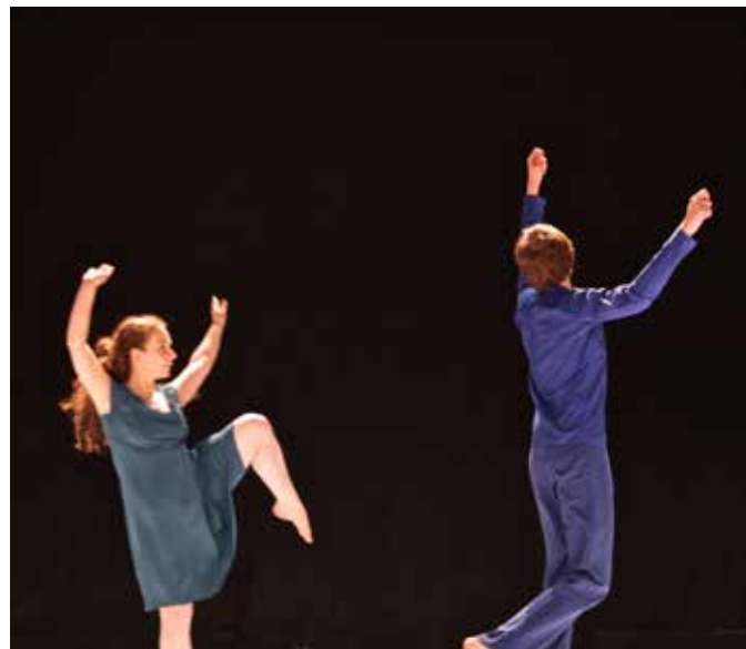
The Art of Bird