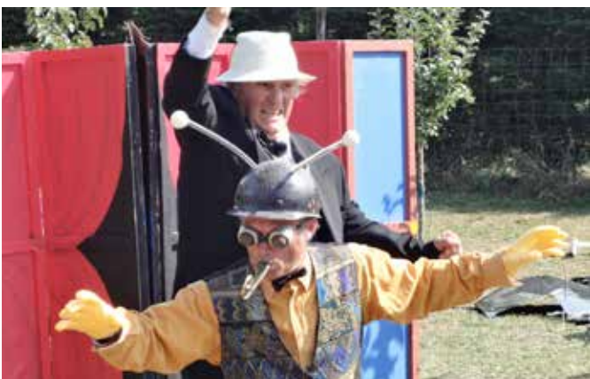
La souplesse de la baleine © Cie L'ARFI

Visionner un extrait du spectacle : http://www.dailymotion.com/video/xwya7r_la-souplesse-de-la-baleine_creation#.UcQFJpMStdM