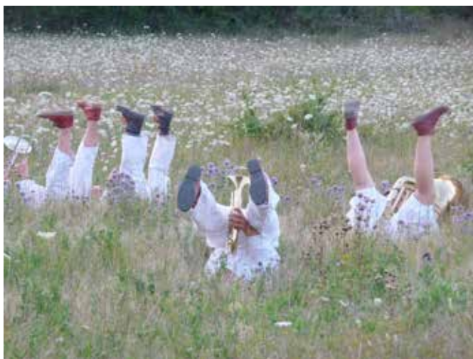
La fanfare d'occasion

http://www.youtube.com/watch?v=zJJ0QscfdBM